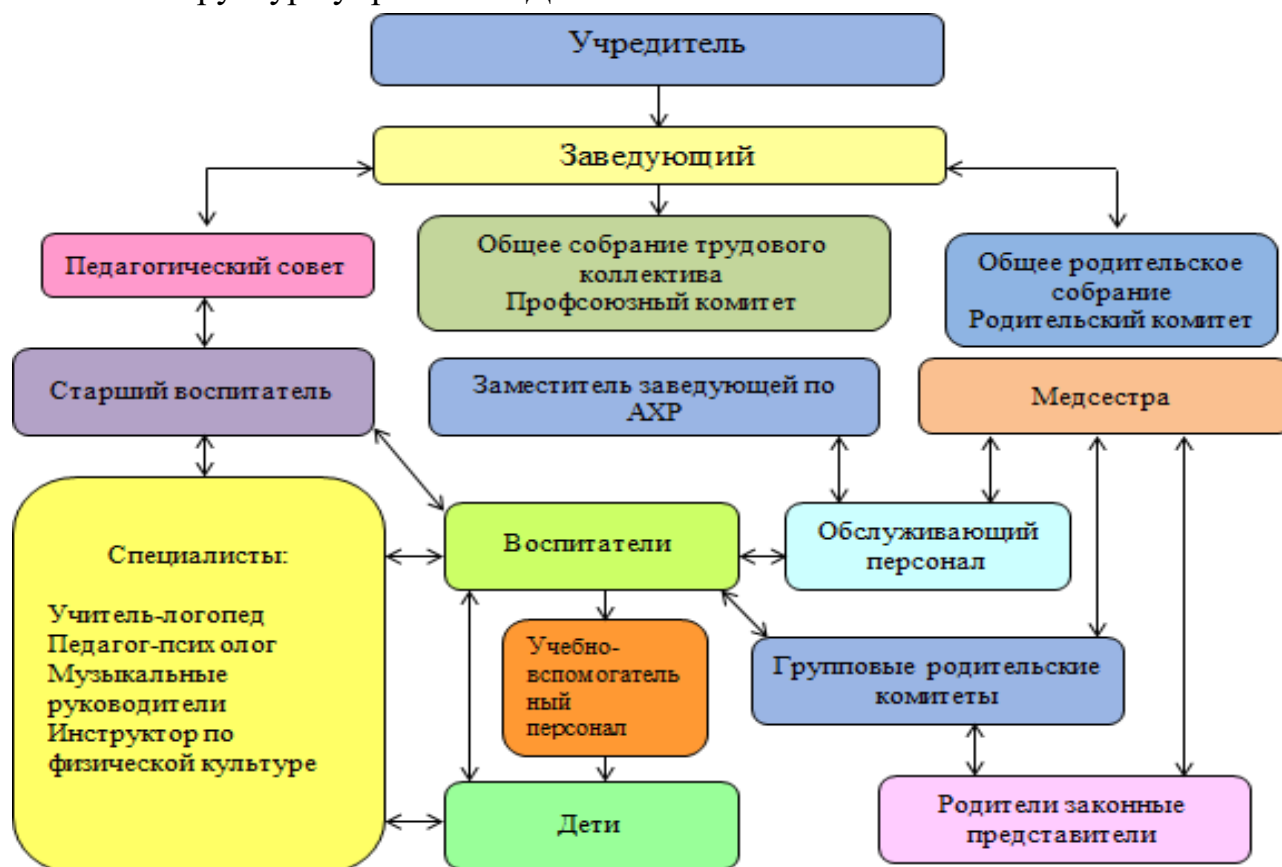
Рис.1 «Структура управления ДООУ»

Управление осуществляется на основе сочетания принципов единоначалия и коллегиальности. Коллегиальными органами управления являются: педагогический совет, общее собрание работников. Единоличным исполнительным органом ДООУ является заведующий, который осуществляет текущее руководство деятельностью ДООУ.